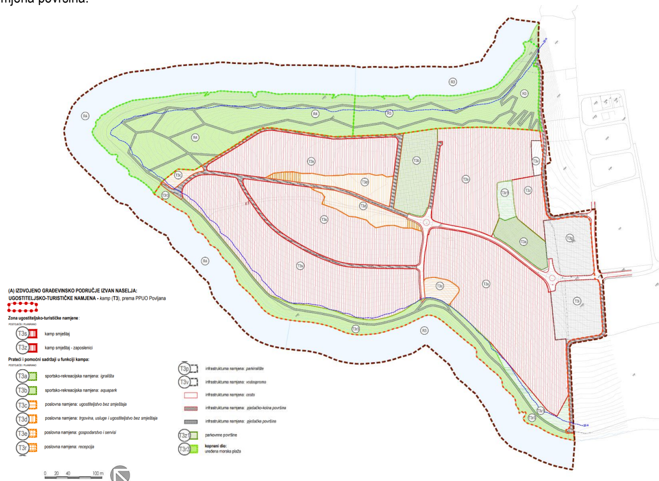
Izvod iz kartografskog prikaza 1. Korištenje i namjena površina- Prijedlog izmjena i dopuna UPU ugostiteljsko turističke zone "Rastovac"

Za područje kampa koji se nalazi unutar obuhvata plana, u cilju podizanja kvalitete turističke ponude kampova i stvaranja prostorno planskih mogućnosti za fleksibilniju realizaciju sadržaja unutar područja kampa, izrađen je masterplan. U skladu s urbanističkim rješenjem iz masterplana te u skladu s planovima šireg područja, ovim Izmjenama i dopunama, redefinirana je namjena površina.