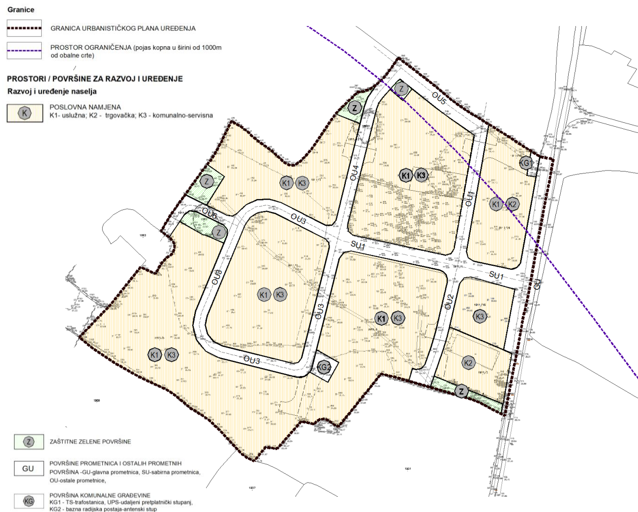
Izvod iz kartografskog prikaza 1. Korištenje i namjena površina, (izmjene i dopune - prijedlog)

Vežano uz korištenje i namjenu površina, ovim izmjenama i dopunama planirana je nova distribucija gospodarskih - poslovnih sadržaja unutar granica zone.